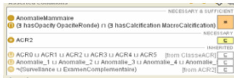
FIG. 2 – Conditions Nécessaires Et/Ou suffisantes De Anomalie1

Les autres anomalies sont représentées de la même manière, et la classe ACR2 est définie comme l’union des sous-classes d’anomalies de 1 à 8 :