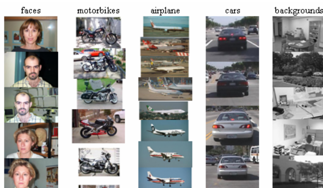
FIG. 1 – Des images extraites de la base Caltech4.

La base est divisée en 10 sous-ensembles, et l'évaluation est faite par validation croisée.