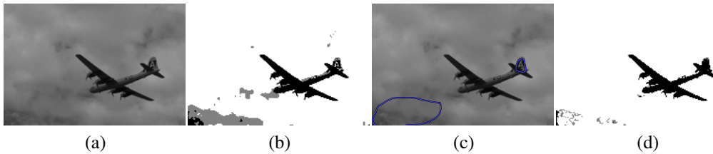
FIG. 2 – (a) image originale, (b) partition crédale obtenue avec SECM, (c) contraintes sur \omega_1 et \omega_2 , (d) partition crédale obtenue avec SECM. Les zones blanches (resp. noires) des partitions représentent \omega_1 (resp. \omega_2 ) et les zones grises \Omega .

Application à la segmentation d'image : L'intérêt de SECM est maintenant illustré avec un exemple de segmentation d'image, ici un avion (cf. Figure 2(a)). Le but est d'isoler l'avion du reste de l'image. Dans une première expérience, nous avons utilisé ECM avec une distance de Mahalanobis. Nous avons considéré qu'il n'existe pas d'objet atypique, donc nous avons fixé \delta^2 à une forte valeur. De plus, nous avons choisi de réduire l'incertitude trouvée par la partition finale en fixant \alpha à une valeur élevée. Ainsi, ECM avec c = 2 , \alpha = 3 et \delta^2 = 1000 trouve la partition crédale dure représentée par la figure 2(b). Nous pouvons remarquer que ECM ne permet pas d'isoler correctement l'avion. Dans une seconde expérience, nous introduisons des contraintes sur la partition comme illustré Figure 2(c). Chaque pixel de la première (respectivement seconde) zone est affectée à \omega_1 (respectivement \omega_2 ). L'algorithme SECM est alors exécuté avec les mêmes paramètres que ECM. La partition crédale résultante est présentée Figure 2(d). Nous pouvons constater que les contraintes ont permis de lever l'indétermination de la plupart des pixels alloués à \Omega .